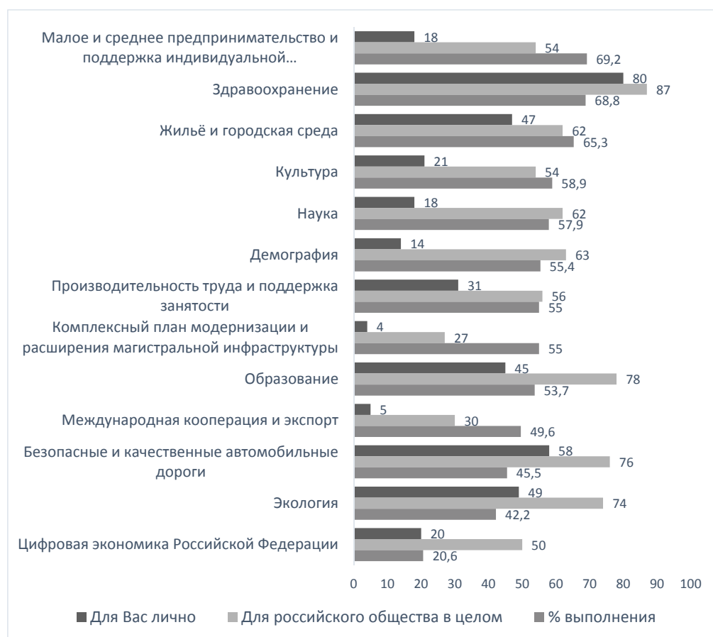
Рисунок 4. Распределение ответов респондентов на вопрос «Какие национальные проекты, на Ваш взгляд, являются наиболее важными?» в сравнении со степенью исполнения федерального бюджета по национальным проектам на 01.10.2020 (РФ, % от числа опрошенных; % исполнения расходов федерального бюджета РФ на реализацию национальных проектов в январе-сентябре 2020 года, ранжировано по % исполнения бюджетов)

Для наглядности на рисунке 3 представлены результаты опросов раздельно по годам, за 2019 и 2020 годы. Определенный интерес может представлять также сравнение оценок респондентов важности национальных проектов в 2020 году с процентом освоения средств на их реализацию к октябрю 2020 года (см. рис. 4).